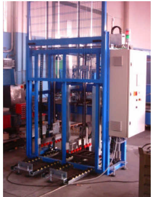
Magazzino automatico pallet

Una particolarità della macchina è il cambio formato automatico del tavolo di accumulo. Le guide dell'imbuto e gli arresti di ghiera ed anelli sono motorizzati e si adattano automaticamente alle dimensioni del raccordo.