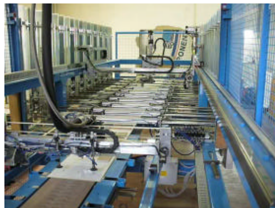
Macchina incollaggio campionari

Un secondo robot preleva le piastrelle e le posiziona nei punti di incollaggio.