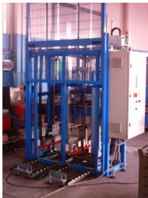
Magazzino automatico pallet

Una particolarità della macchina è il cambio automatico del tavolo di accumulo. Le guide dell'imbuto e gli arresti di ghiera ed anelli sono motorizzati e si adattano automaticamente alle dimensioni del raccordo.